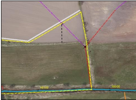
Figur 2. Afværgeforanstaltninger for den vestlige (tv) og østlige (th) del af projektområdet. Brønden bliver ikke sløjfet, som figuren ellers viser. Betegnelser kan findes i signaturforklaringen på Figur 1. Dette er Figur 6 i høringsmaterialet.

I projektets østlige grænse mellem matrikel 2o og 3æ Vong By, V. Nykirke er der på figur 5 og 6 i projektforslaget vist at brønden, der ligger i skel bliver sløjfet. Dette er en fejl på figuren. Dræn C, som beskrevet i materialet, bliver ført ned i projektområder via nyt glatrør, hvor drænvandet vha. et afskrab føres ned til lavningen omkring 18.080 m (Figur 2).